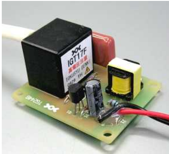
TOT801 ~ 804 高圧ケーブルはオプション